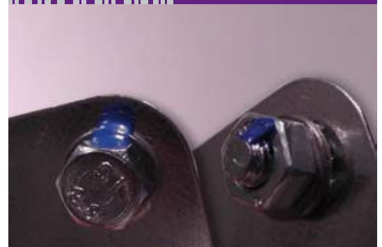
Beispiel einer klassischen Schraubensicherung mit dem topsecure Sicherheitslack