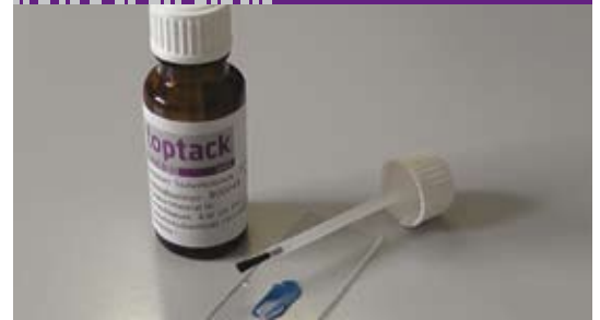
Einsatz von topsecure Sicherheitslack im Muster- und Prototypenbau