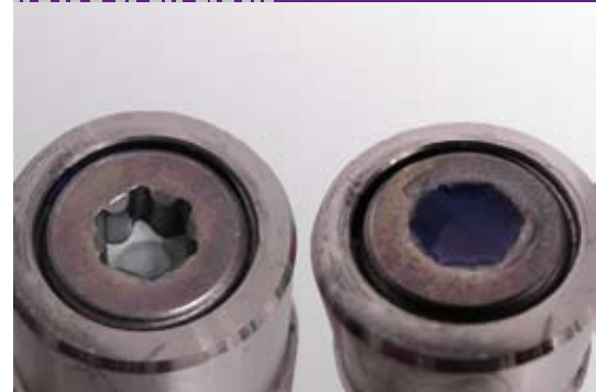
Schraube eines geprüften Bauteils in Großserie (ohne und mit TSS-Lack-Sicherung)

Mit unserer topsecure Sicherheits-Technologie lassen sich z.B. Solarmodule ein Produktleben lang identifizieren. Der Lack wird aufgebracht und lässt den eindeutigen Nachweis der Echtheit von Modulen zu. Gewährleistungsansprüche können so über Jahrzehnte zuverlässig nachgewiesen, bzw. auch abgewehrt werden. Die Kennzeichnung trägt zudem zur Diebstahlprävention bei. Bei Diebstahl der Solarmodule kann durch den aufgetragenen TSS-Lack an geeigneter Stelle, im Rahmen der Ermittlungen eine eindeutige Identifikation und Beweisführung erfolgen.